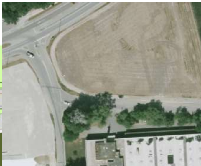
Rietstrasse: Auszug Orthophoto