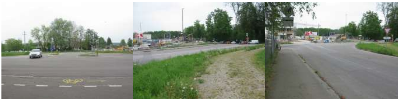
Rietstrasse: Fotos Ist-Zustand